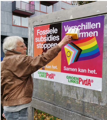
Posters plakken is een belangrijk deel van de campagne, met name vlak voor de verkiezingen