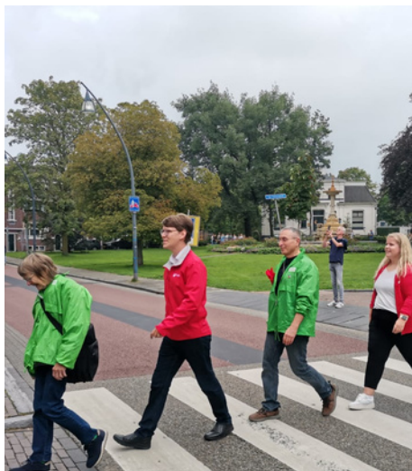
Zijn het The Beatles ? Nee, het zijn de enthousiaste en onvermoeibare vrijwilligers van GroenLinks en PvdA!