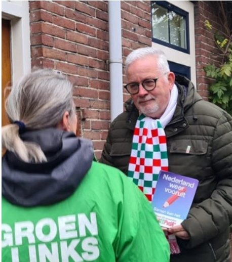
Samen kan het: op 2 september trapt men met PvdA Zwolle de campagne af voor de landelijke verkiezingen